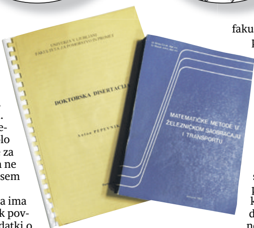
Disertacija in knjiga, po ideji katere naj bi nastala. Primerjave med Pepevnikovo doktorsko disertacijo in knjigo so predstavljene na spletni strani http://pepevnik-plagiat.pohorje.cc/ .