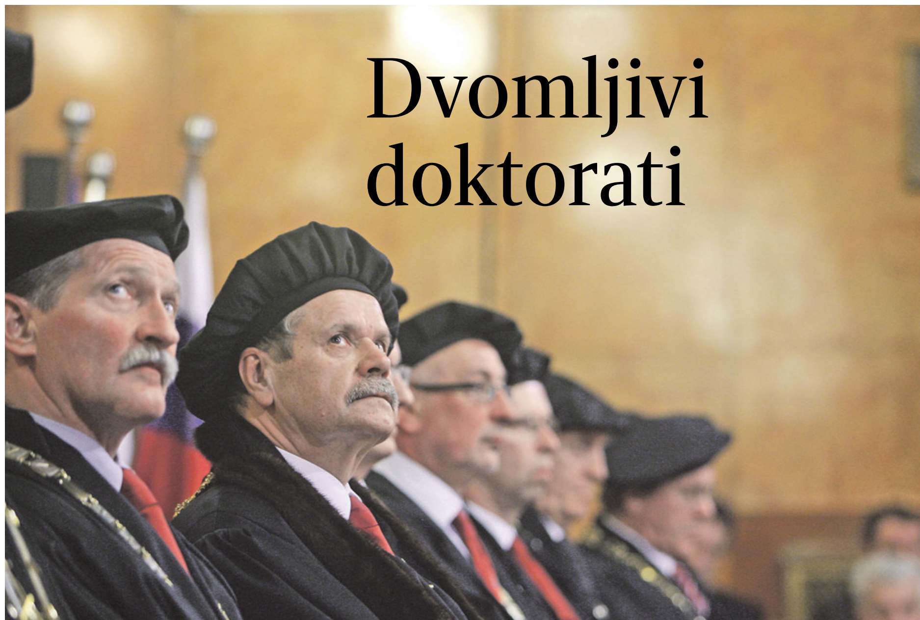
DOKTORSKI NAZIVI – So jih na ljubljanski univerzi podeljevali tudi takim, ki si jih niso zaslužili?