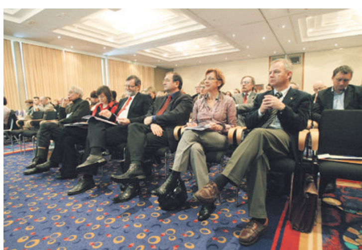
Ministrstvo za visoko šolstvo, znanost in tehnologijo ni pristojno za odvzeme strokovnih in znanstvenih naslovov.

sko disertacijo pregledoval, toda imena nam ni hotel zaupati, češ da so zdaj vsi proti njemu. »Vseh deset predavateljev je potegnilo skupaj. Kolega, s katerim se poznavam 41 let in mi je pri doktoratu tudi pomagal z nekaterimi izračuni, mi zdaj to očita.« Zgodba je po njegovem konstrukt. Čakali naj bi na pravi trenutek: »Niso vedeli, kako bi se me znebili, in so se me tako. O tem sem prepričan! Res pa je, da sem sam prehitro reagiral. Odpoved sem preklical, vendar prepozno. Najbolj me je vrglo iz tira, ko so rekli, da bodo šli v javnost, če ne odstopim. Želel sem zaščititi družino, pa mi ni uspelo. Polomil sem ga in danes mi je strašansko žal, da sem dal odpoved, kajti s tem sem ravnal, kot da sem priznal. Toda takrat nisem tako razmišljal. Upam si trditi, da sem žrtev.« Do upokojitve mu manjkata dve leti in pol, zdaj se bo prijavil na zavod za zaposlovanje, saj nima zaposlitve.